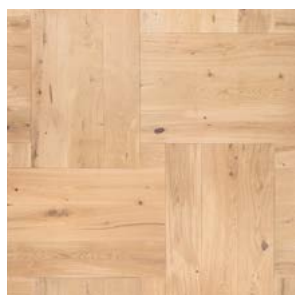
P01 Prelevigato Unfinished

SPESS./THICK 15mm LARGH./WIDTH 185-230mm LUNGH./LENGTH 810-1010mm